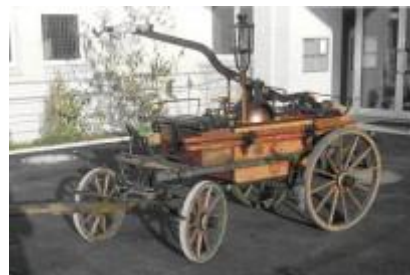
Handdruckspritze 1883 der Gebr. Gimpert Künacht ZH Heute im Besitz des Feuerwehrverein Vordemwald