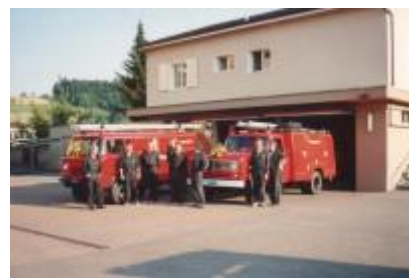
Feuerwehrmagazin beim Schulhaus (1963 - 1991) anlässlich des Umzugs ins neue Magazin an der Gländstrasse