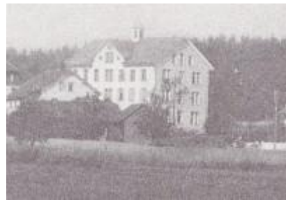
Spritzenhaus an der heutigen Langenthalerstrasse

1889 Bau eines Spritzenhauses an der Landstrasse im Dorf zum Einstellen der Saugspritze Die Schöpfspritze wird stationiert im Scheurerhof auf Benzlingen.