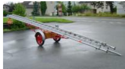
Alu-Strebenleiter 1976, Länge 14,2m