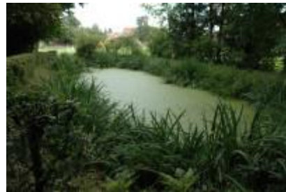
Feuerweiher auf dem Rümliberg Aufnahme:2006

1808 Anlegen von drei Feuerweihern (Propstholz auf Oberbenzlingen, auf dem oberen Rümliberg am Unterwald und auf Chratzeren am Unterwald).