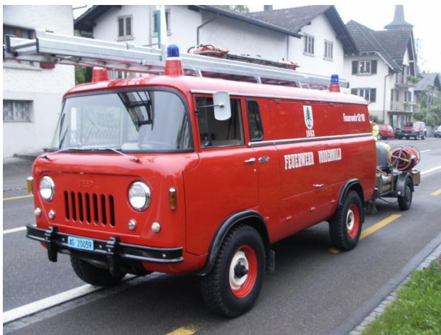
Willys Jeep FC-170 der Feuerwehr Vordemwald

Von 1957-1964 wurde von Willys eine ganz besondere Variante angeboten, das Modell FC (= Forward Control (Frontlenker)). Der FC-150, Nutzlast \frac{3}{4} t, mit 4-Zylinder Motor, 75 PS, und der FC-170, Nutzlast 1 t, mit dem 6-Zylinder Motor