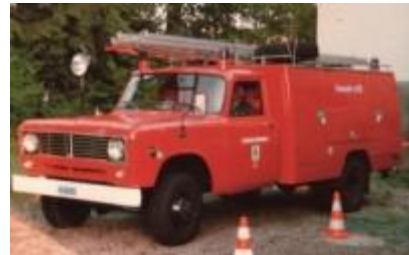
Kleintanklöschfahrzeug Rosenbauer 1973. Bis 1997 im Einsatz.