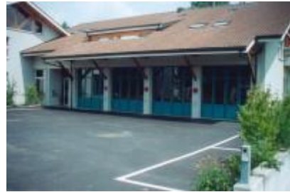
Feuerwehrmagazin an der Gländstrasse. Eingeweiht 1991

1991 Einweihung Mehrzweckgebäude am 8. Juni (Werkhof, Zivilschutz, Feuerwehr)