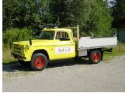
Ehemaliges Oelwehrfahrzeug der Feuerwehr Zofingen. Seit 2004 als Zugfahrzeug in der Feuerwehr Vordemwald im Einsatz

2001 Mowag W 200 der ZSO Region Zofingen wird im Feuerwehrlokal Vordemwald stationiert und kann von der Feuerwehr benutzt werden. Per 1. Mai 2004 definitive Übernahme durch die Feuerwehr Vordemwald.