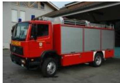
TLF MB 1224, Aufbau Vogt, 1997

1997 TLF MB 1224 Einweihung am 8. November (Ersatz für International)