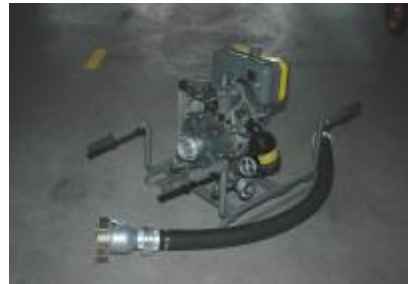
Motorblockspritze Typ 1-86

1994 Vom Zivilschutz werden die Motor-Blockspritzen Typ 1-86 ZS übernommen.