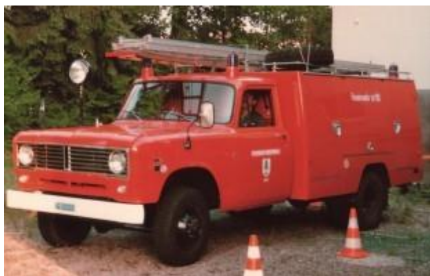
TLF International 1310 der Feuerwehr Vordemwald

In den 70er Jahren verfügten noch viele kleinere Gemeinden nicht über Tanklöschfahrzeuge. Die rege Bautätigkeit und Zunahme der Bevölkerung liessen auch die Brandgefahr ansteigen und das Tanklöschfahrzeug mit dem mitgeführten Wasservorrat ist das wirksamste Ersteinsatzfahrzeug.