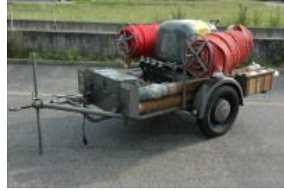
Motorspritze ZS Typ 2