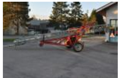
Übernahme von der Feuerwehr Rothrist Motorisierte Anhängeleiter, 1973

2009 Übernahme der motorisierten Anhängeleiter von der Feuerwehr Rothrist.