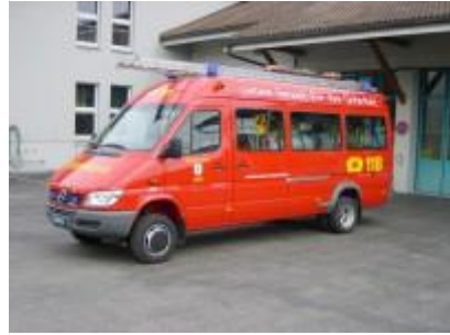
Pikettfahrzeug MB Sprinter 416 CDI

2004 Pikettfahrzeug MB Sprinter Einweihung am 27. März (Ersatz für Willys Jeep).