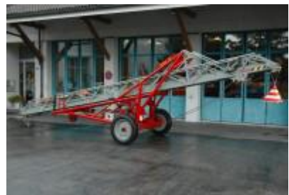
Übernahme von der Feuerwehr Zofingen: Mech. Anhängeleiter, 1965

2006 Übernahme der mech. Anhängeleiter von der Stützpunktfeuerwehr Zofingen.