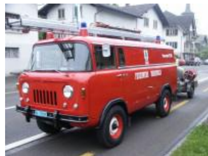
1. Fahrzeug der Feuerwehr Vordemwald: Willys Jeep Heute im Besitz des Feuerwehrverein Vordemwald