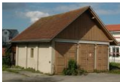
Spritzenhaus (Scheibenstrasse) erbaut 1928