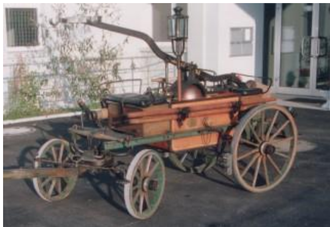
Handdruckspritze Gimpert 1883 der Feuerwehr Vordemwald.